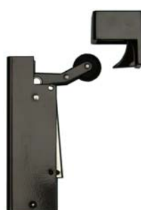
Bruin (RAL 8017)