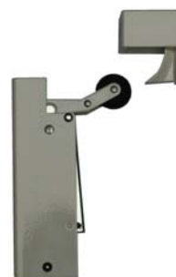
Grijs (RAL 9006)