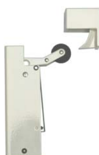
Wit (RAL 9010)